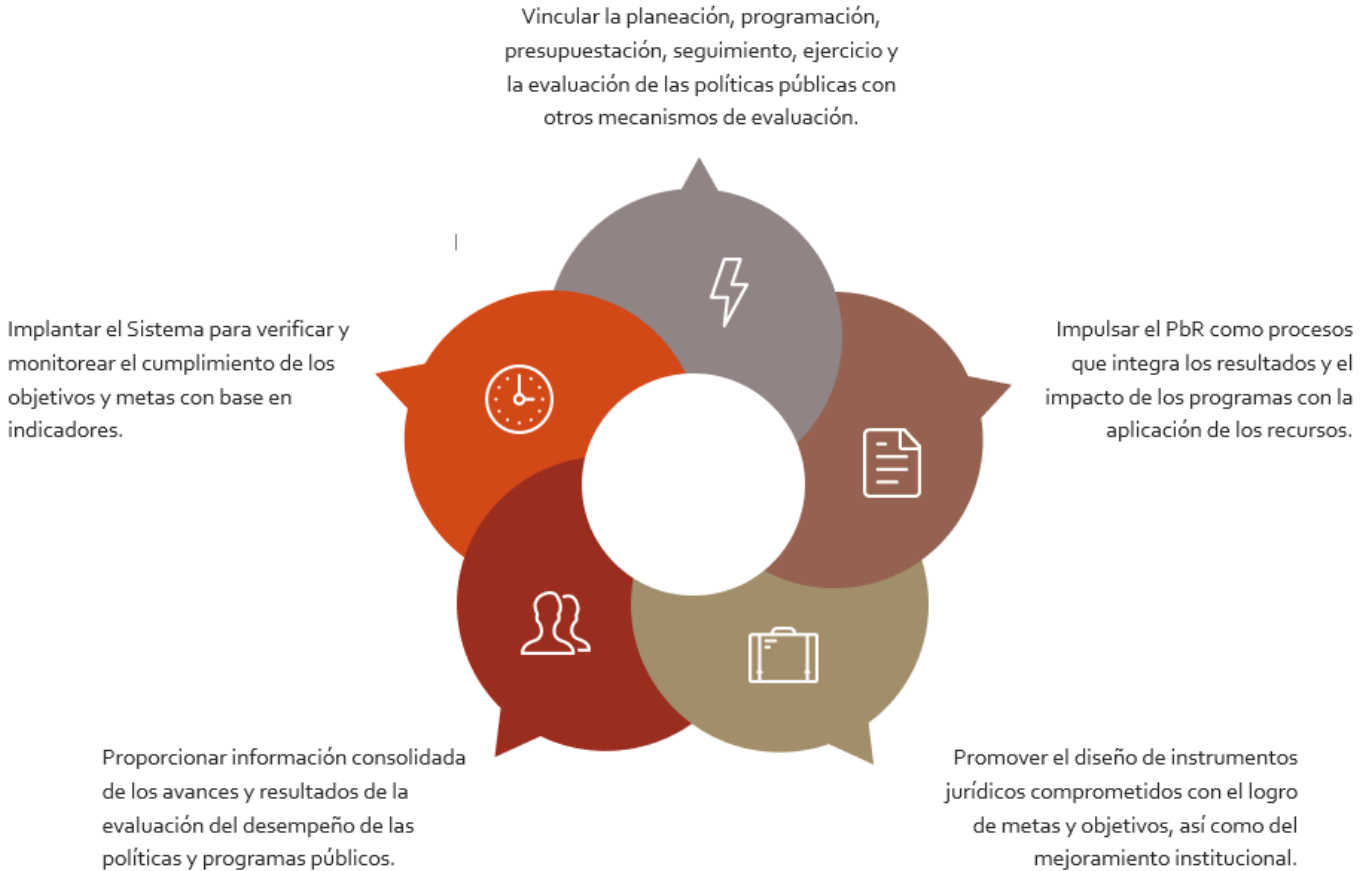
Figura 1. Objetivos del Sistema de Evaluación del Desempeño.

En conclusión, el SED es considerado como el conjunto de elementos metodológicos con el que se realiza el seguimiento y la evaluación sistemática bajo la óptica de un enfoque hacia resultados, además, brinda información para poder valorar de manera objetiva lo que se ha realizado, proporcionando elementos necesarios para la adecuada toma de decisiones sobre los procesos y programas en marcha, modificándolos, reforzándolos, y asignando o reasignando los recursos de ser necesario.